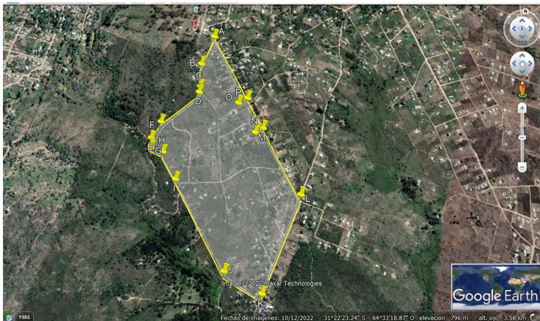
Figura: Polígono propuesto para las obras de realineamiento de calles 36,6Ha.

La notificación mencionada hace referencia a que se debe indicar fehacientemente el tamaño del proyecto en cuestión. Atento a esto, se informa que el polígono a afectar por las obras de realineamiento será de 36,6ha de acuerdo con la siguiente figura.