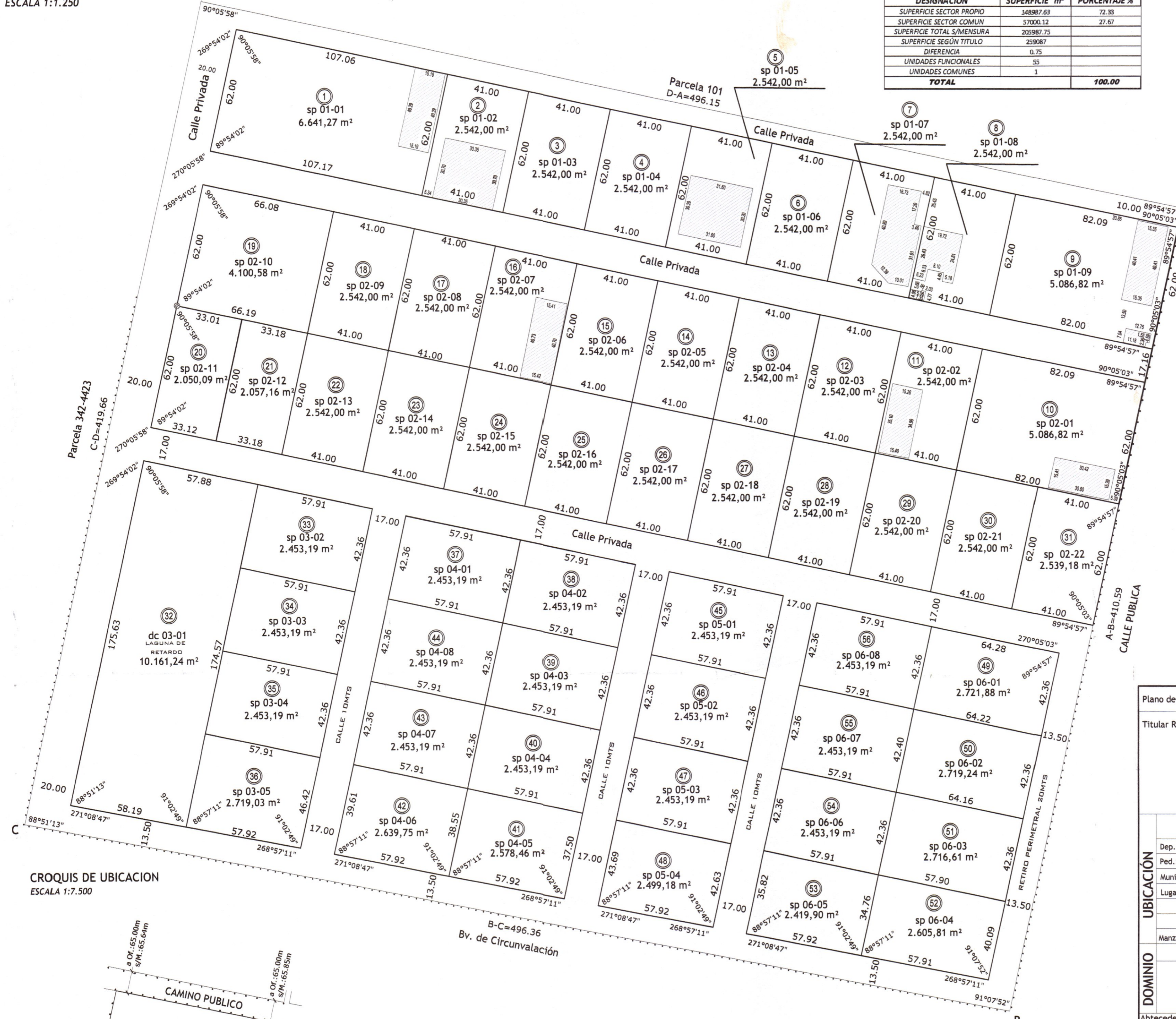
CROQUIS DE UBICACION ESCALA 1:7.500