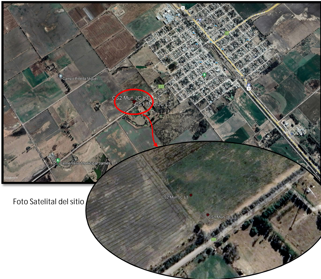
Foto Satelital del sitio