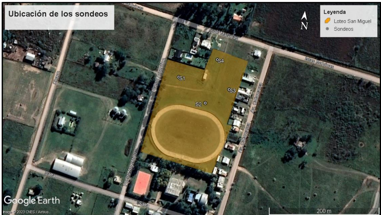
Fig.2: Ubicación de sondeos en detalle.