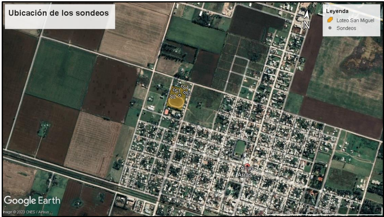
Fig.1: Ubicación de los sondeos. Imagen tomada desde Google Earth