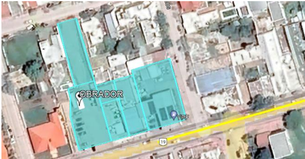
Imagen 2: Obrador